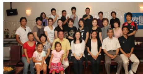
ウェルカムパーティー