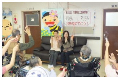
介護福祉士国家試験合格発表